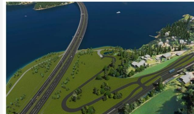
LITEN UTFYLING: Slik er planene for Sundvollen med liten utfylling.