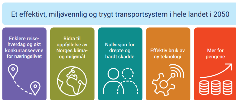
Figur 2-3: De overordnede målene i Nasjonal transportplan 2025-2036. (Kilde: NTP, 2024).

Målet med planarbeidet er å skape et effektivt, miljøvennlig og trygt transportsystem i 2050, i tråd med Nasjonal transportplan (NTP). Av dette følger fem likestilte mål: